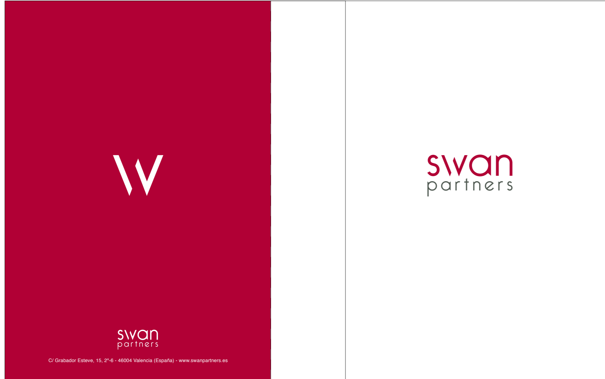
Sobre americano (tamaño real 22x11cm)