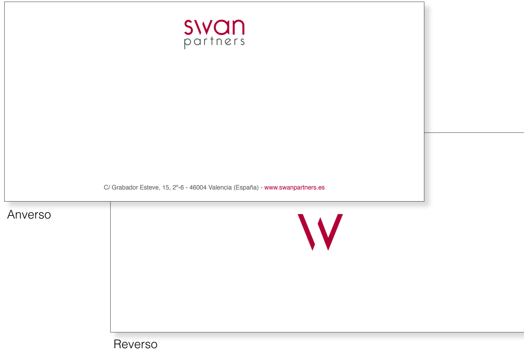
Tarjetón (tamaño real 21x10cm)